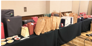
家族会にて。見よ!豪華景品の山!

実際に開催したイベントで特に印象的だったのが「飲食店応援キャンペーン」と「春の家族会」です。前者ではいつもお世話になっている飲食店さまに少人数で分かれて訪ね、ベアレンビールと共に食事を頂いた企画で、後者は先月号にも載せましたが、参加人数は少ないながらも年祝やじゃんけん大会(豪華景品付き)を盛り込んだいい家族会でした。