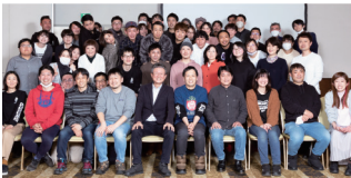
2022年度もお楽しみに!