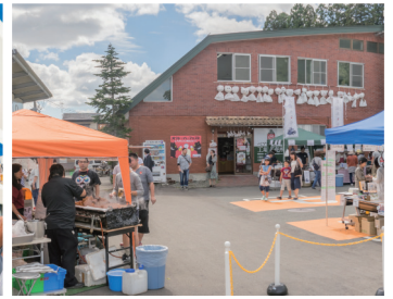
お客さまとスタッフの交流も大切にしています