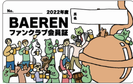
カードになったファンクラブ会員証

昨年よりファンブックという名前で、地元のお客さまを中心にベアレンビールをご愛顧している皆さんに様々な特典を掲載した冊子を販売してまいりました。冊子ですと作る手間も大変ですし、変更があっても修正できません。その改善の意味もあり、今年度より冊子をやめてカード型の会員証にして、特典はウェブ掲載にすることにしました。 そして名称も「ベアレンファンクラブ」と一新しました。ごなたでもご入会いただけますが、特典は岩手に住んでいる人のほうが多い内容となっています。 ベアレンはファンを多く生み出すことを大事にしてきました。どんなヘビューザーの方でも、最初の一步は必ずありました。そんなトライアルを生み出す場を大切に、それをリピートにつなげていき、やがてベアレンファンに昇華させていく。それがベアレンの大切にしていることの一つです。