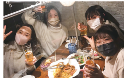
飲食店応援キャンペーンは大好評でした

2021年度末にはスタッフにアンケートをとって今年度の社内イベントがどうだったか、感想をもらいました。「行ったことのないお店に行けてよかった」「普段別の場所働いているスタッフと交流が図れてよかった」「コロナ禍でも楽しくイベントに参加できた」などと、沢山嬉しい声をもらい、私たちも頑張つて企画してよかったと心から思っています。