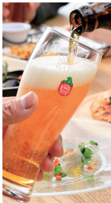
グラスに注がれるビール

ものだったら、と願っています。それを引き起こすのはビールの味わいだったり、造っている人の顔が思い浮かぶことだったり、会社のイメージだったり様々でしょう。そういった特別な、ベアレンでしか味わえない雰囲気を感じることができているのがクラフトビールの良さであり、贅沢さだと思っています。 時にはそんなビールを飲む贅沢や幸せを感じることが必要だと思います。私はそう信じて今までやってきました。そしてその共感の輪が広がってきているのが今のベアレンの状況なのかと思っています。 今年、ベアレンビールが世に出て19年、20年目の扉が開きます。私たちはこの初心を今一度思い出し、私たちが造るものによって少しでも世の中をよくしていければと考えていきます。そして岩手、盛岡でその思いをより一層深めていき地域に根差した文化に醸成させ、そしてそれを感じに岩手に来る人が増えることによって地域の活性化に役立っていきたくて考えています。新年度にあたり、そんな思いを新たにしています。